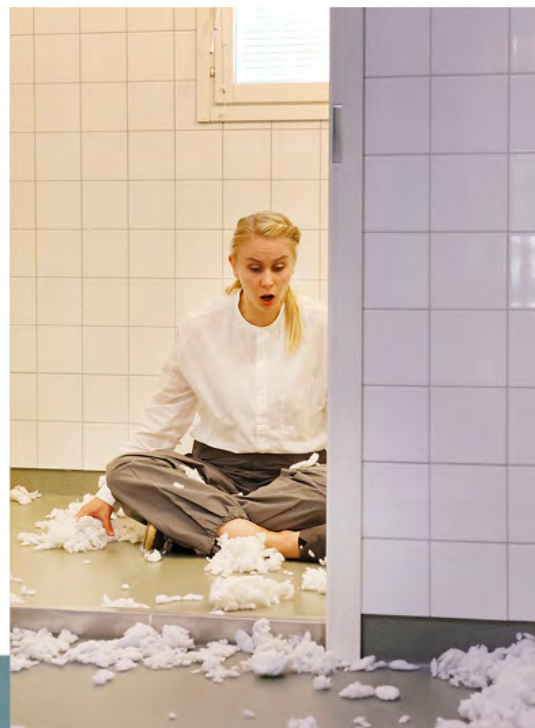
Eleriin Määripeal, sopraano